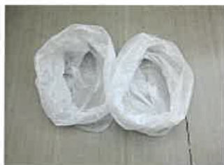
①回収袋を2つ準備する (一次・二次回収袋)