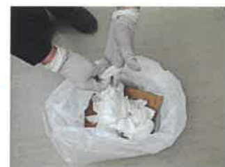
⑥外側の手袋のみを 回収袋に捨てる