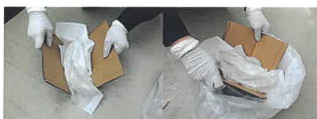
④段ボールやヘラなどを利用して嘔吐物を 掻き集め、回収袋(一次)に入れる