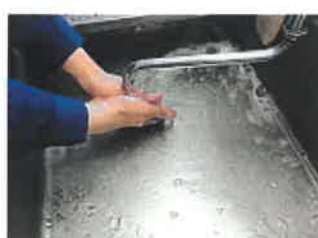
⑩処理が終わったら、うがいと手洗いをする