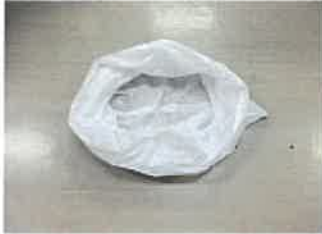
①回収袋を準備する