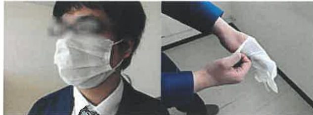
②マスクを着け、ゴム手袋を着ける