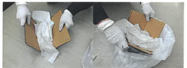
④段ボールやヘラなどを利用して嘔吐物を掻き集め、回収袋(一次)に入れる