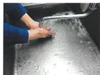
⑧処理が終わったら、うがいと手洗いをする