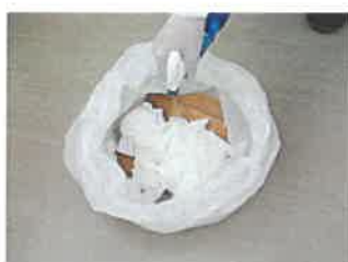
⑦回収袋内に殺菌剤(クレベリン) を散布する