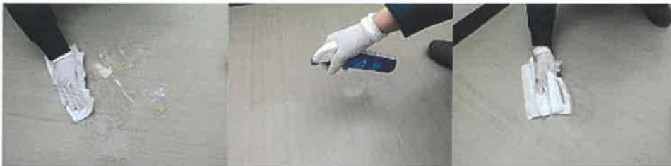
⑤残った嘔吐物をキッチンペーパーで拭き取り、殺菌剤(クレベリン)を散布して床を拭く