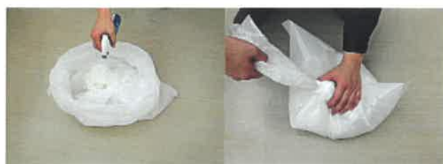
⑨袋内に殺菌剤(クレベリン)を散布後しっかりと縛り、 密閉出来るゴミ箱に捨てる