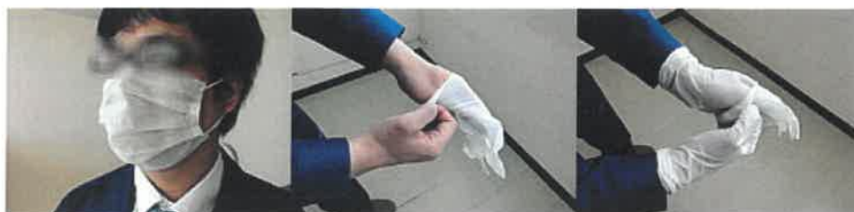
②マスクを着け、ゴム手袋を二重に着ける