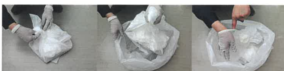
⑧回収袋をしっかりと閉じ、ゴム手袋・マスクとともに もう一つの回収袋(二次)に入れる