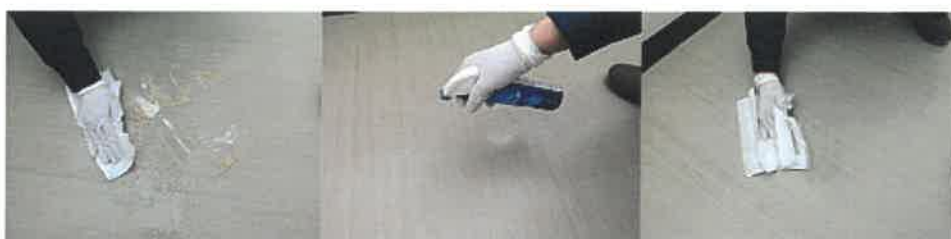
⑤残った嘔吐物をキッチンペーパーで拭き取り、殺菌剤(クレベリン)を散布して床を拭く