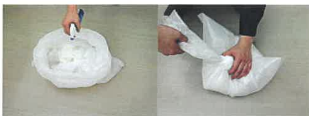
⑦袋内に殺菌剤(クレベリン)を散布後しっかり縛り、密閉出来るゴミ箱に捨てる