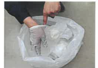
⑥手袋とマスクを回収袋に捨てる